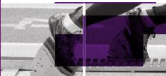
Table ronde : « La création d'entreprise est-elle une voie de reconversion pour les sportif(ve)s de haut niveau ? »